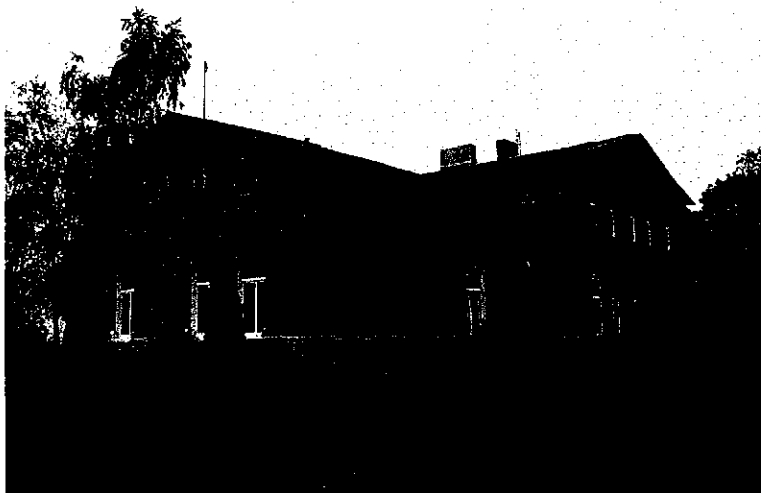
Zdjęcie nr 17. Dwór, Zagajewiczki nr 12

Powstał w ok. 1890 r. Budynek dwukondygnacyjny z parterowym skrzydłem od płd., nakryty płytkimi dwuspadowymi dachami. Ściany murowane z cegły, partia cokołowa tynkowana, detal ceglany: łukowe gzymsy nadokienne w obu kondygnacjach.