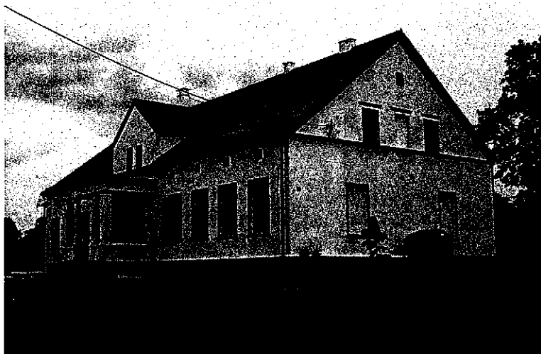
Zdjęcie nr 19. Dwór, Modliborzyce nr 10

Powstał na pocz. XX w. Dwór na rzucie prostokąta, podpiwniczony, parterowy, z mezzanino, nakryty dwuspadowym dachem. W dziewięcioosiowej fasadzie skromny portyk czterokolumnowy, poprzedzony schodami.