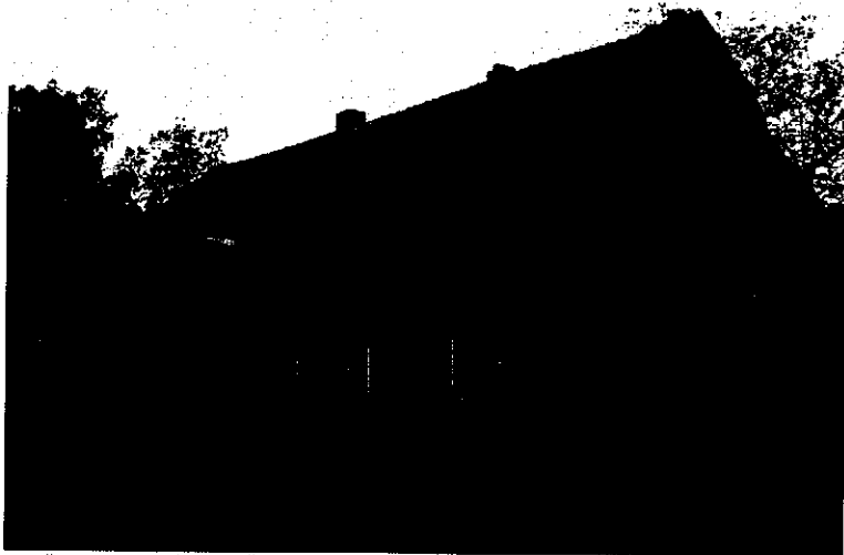
Zdjęcie nr 20. Dwór, Dziewa nr 1

Powstał na koniec XIX w. Parterowy budynek na rzucie prostokąta, z prostokątnym gankiem w fasadzie, nakryty dwuspadowym dachem. Na skutek przebudów pozbawiony cech stylowych. Obecnie nieużytkowany.