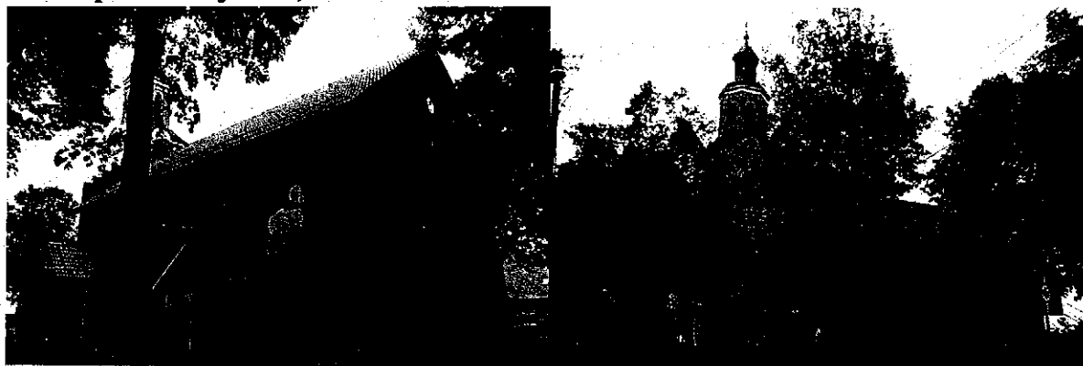
Zdjęcia nr. 3, 4. Kościół pw. Św. Wojciecha, Parchanie

Dzieje parafii sięgają XI w. – z tego okresu pochodzą pochówki biskupów kruszwickich: Wenancjusza zmarłego w 1055 r. i Andrzeja Rzymianina zmarłego w 1081 r. Pierwszy kościół zbudowano w Parchaniu ok. 1000 r., w 1655 r. został spalony przez Szwedów. W 1840 r. zbudowano obecny. W 1900 r. dobudowano kruchtę, rok później – neobarokową wieżę.