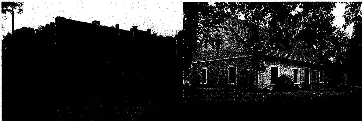
Zdjęcie nr 14, 15. Dwór, Parchanie nr 33

Dwór Generała Władysława Sikorskiego pochodzi z XIX w., bez wyraźnych cech stylowych. Wzniesiony na rzucie prostokąta, z pozornym ryzalitem na osi fasady, w partii dachu zwieńczonym obszerną, prostokątną facjatą. Nakryty wysokim, dwuspadowym dachem. Ryzalit i facjata akcentowane parami pilastrów. Na fasadzie – tablica informacyjna o generale Sikorskim. W 2018 r. przeprowadzono prace remontowe przy dworze i parku.