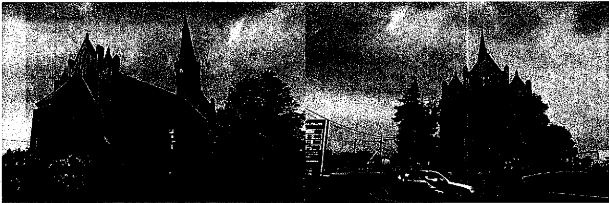
Zdjęcia nr 9, 10. Kościół pw. Wniebowzięcia NMP, Dąbrowa Biskupia

Wzniesiony w 1872 r., jako ewangelicki, od 1945 r. katolicki, filialny. Kościół orientowany, jednonawowy, nakryty dwuspadowym dachem, z czterokondygnacyjną wieżą w fasadzie i poligonalnie zamkniętym, mniejszym prezbiterium. Budynek oszkarpowany, ściany szczytowe ujęte narożnymi szkarpami, zwieńczone kotarowymi, wieloczłonowymi szczytami ze sterczynami. Ściany murowane z cegły na kamiennym cokole, detal ceglany (blendowe podziały szczytów, ażurowa balustrada zwieńczenia wieży, gzymsy). Otwory okienne zamknięte ostrołucznie. Ostrołuczny otwór drzwi o profilowanych węgarach, zwieńczony wimpergą, ujęty parą filarków ze sterczynami.