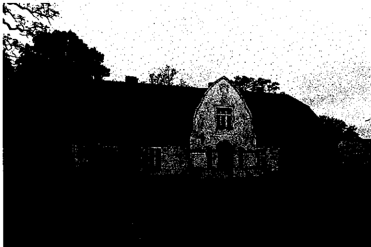
Zdjęcie nr 12. Dwór, Sobiesiernie nr 9

Dwór wzniesiony w pocz. XX w., ok. 1910 r., remontowany w latach 1970-1973, obecnie jest własnością prywatną. Dwór wzniesiony na rzucie wydłużonego prostokąta, z nieznacznym ryzalitem zwieńczonym wysokim frontonem – na osi fasady, nakryty wysokim naczółkowym dachem kryjącym użytkowe poddasze. Do pñ. szczytu przylega parterowa, płasko nakryta oficyna, do pñd. – drewniana weranda. Elewację ogrodową poprzedza obszerna weranda, poprzedzona schodami.