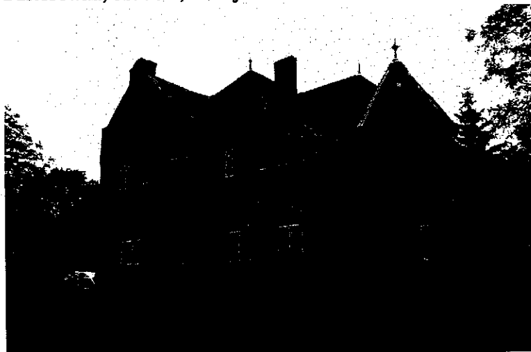
Zdjęcie nr 13. Pastorówka, ob. dom, Radojewice nr 42

Budynek pochodzi z ok. 1890 r., eklektyczny o znacznie rozczłonkowanej bryle, podpiwniczony, dwukondygnacyjny, kryty dachem wielospadowym z naczółkiem. W pñd.-zach. narożu – pięcioboczna, dwukondygnacyjna wieża kryta dachem namiotowym. Przed wejściem ganek z ceglany murkiem. Budynek częściowo licowany cegłą, częściowo tynkowany.