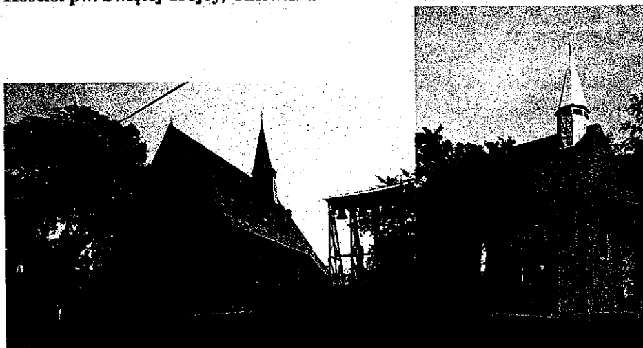
Zdjęcia nr 7, 8. Kościół pw. Świętej Trójcy, Chlewiska

Parafia wymieniana jest od XV w. Obecny, neogotycki kościół wzniesiono w 1910 r., konsekrowano w 1916 r.