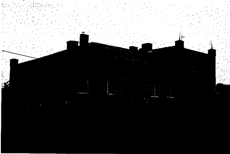
Zdjęcie nr 16. Dwór, Pieranie nr 28-29

Dwór pochodzi z 2 poł. XIX w., wzniesiony z materiału uzyskanego z wież kościelnych, rozebranych w 1853 r. Budynek na rzucie prostokąta, wysoko podpiwniczony, złożony z pięcioosiowej części parterowej z mezzaninem, nakrytej dachem czterospadowym oraz poprzecznej części dwukondygnacyjnej, nakrytej płasko. Naroża ścian akcentowane czworobocznymi filarkami, zwieńczonymi sterczynami – powyżej okapu dachów. Ściany części niższej rozczłonkowane lizenami. Zmieniony kształt otworów okiennych i późniejsze remonty spowodowały utratę cech stylowych.