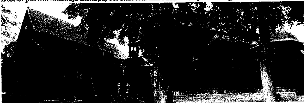
Zdjęcia nr 1, 2. Kościół pw. Św. Mikołaja Biskupa, ob. Sanktuarium Matki Bożej Łaskawej, Pieranie

Największy drewniany kościół w Polsce, wzniesiony w latach 1732-1734 przez cieślę Jakuba Gaca z Zegrza. Jest jedną z największych w Polsce drewnianych bazylik krytych gontem. W 1736 r. zbudowano dwie barokowe wieże, rozebrane w 1853 r. Kilkakrotnie remontowany: 1825 r., 1894 r. – odnowienie polichromii przez Henryka Jaguszewskiego w 1951 r. przez Franciszka Cholewińskiego. Ważniejsze remonty w 1901 r., 1933 r., 1947 r., 1963 r. (zmiana dachówki na gont), remont kapitalny w latach 2003-2008 i renowacja polichromii latach 2009-2015. Świątynia jest najważniejszym sanktuarium ziemi kujawskiej określanym mianem „Częstochowy Kujaw”.