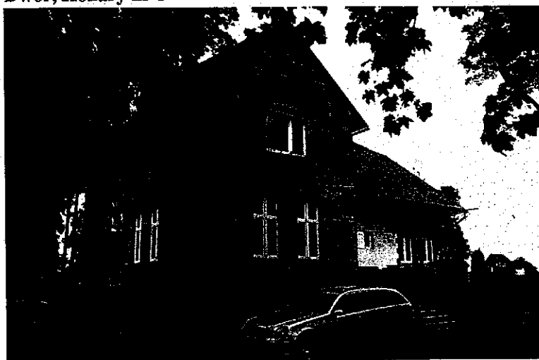
Zdjęcie nr 18. Dwór, Konary nr 8

Pochodzi z ok. 1850 r., przebudowany w 1900 r. Budynek częściowo podpiwniczony, jednokondygnacyjny, na rzucie prostokąta, w partii środkowej podwyższony o facjatkę, nakryty dachem dwuspadowym. W wyniku przebudowy stracił większość cech stylowych.