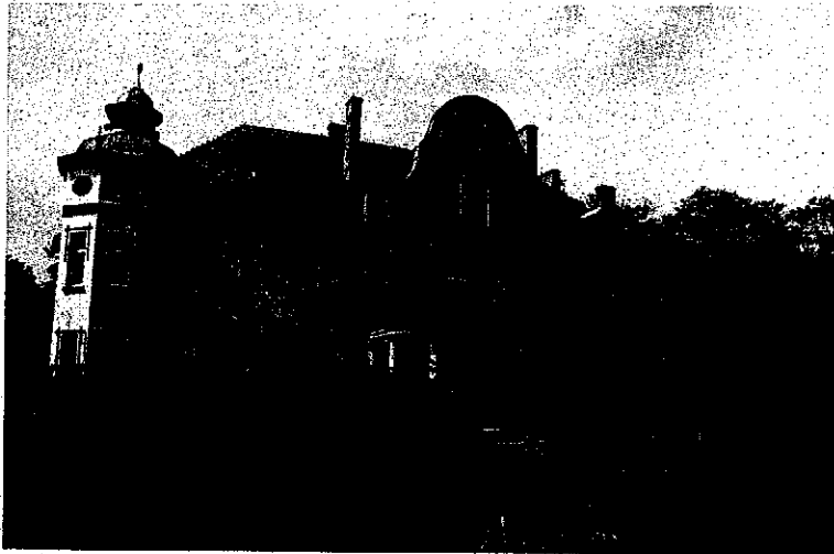
Zdjęcie nr 11. Dwór, Wola Stanomińska nr 2

Dwór wybudowany w latach 1920-1925, gruntownie remontowany w latach 1973-1974. Budynek neobarokowy na rzucie prostokąta, dwukondygnacyjny, przykryty dachem czterospadowym. W pld.-wsch. narożu – pięcioboczna, dwukondygnacyjna z mezzanino wieża przykryta niskim dachem baniastym z latarnią. Pośrodku fasady płytki ryzalit zwieńczony neobarokowym frontonem, poprzedzony gankiem kolumnowym (kolumny jońskie). W elewacji pñ. niewielki aneks o ścianach w konstrukcji ryglowej. Detal skromny, wypracowany w tynku: płaskie gzymsy, opaski ujmujące okna od góry.