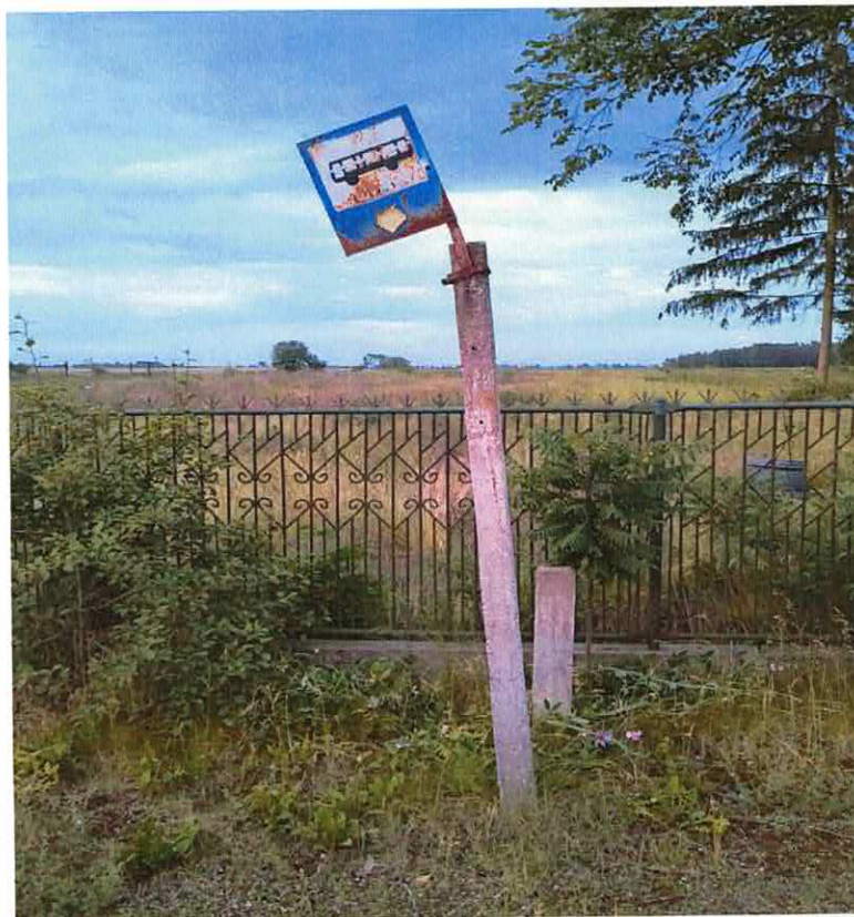
Drogowy znak informacyjny D-15 „przystanek autobusowy” przy posesji nr 18