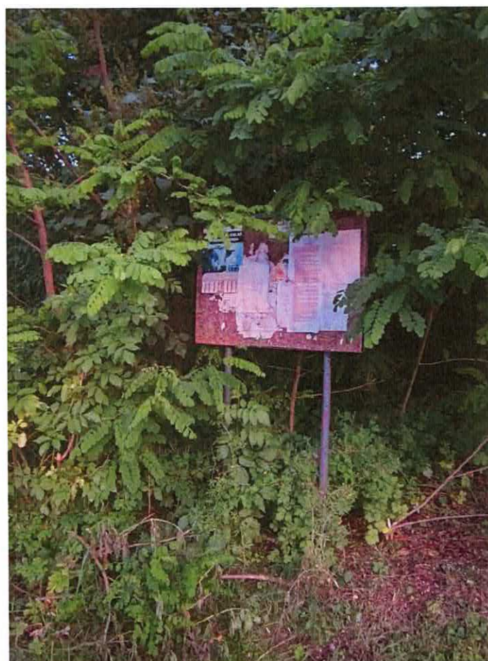
Tablica informacyjna w miejscowości Konary przy posesji nr 18