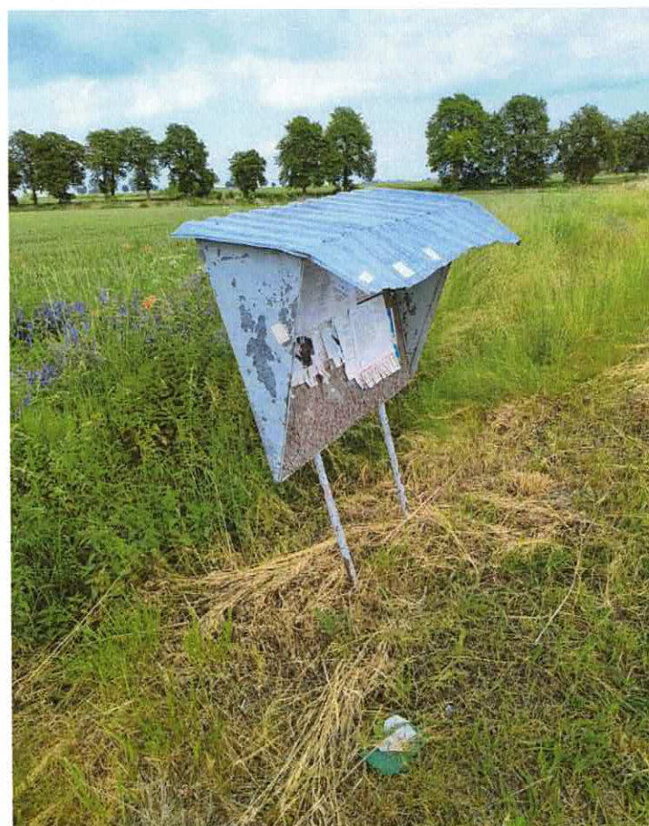
Tablica informacyjna w miejscowości Dziewa (wjazd od Konar po prawej stronie jezdni)